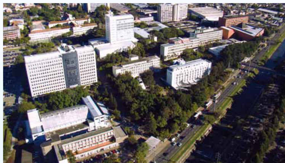
► Campus PUCRS 2010