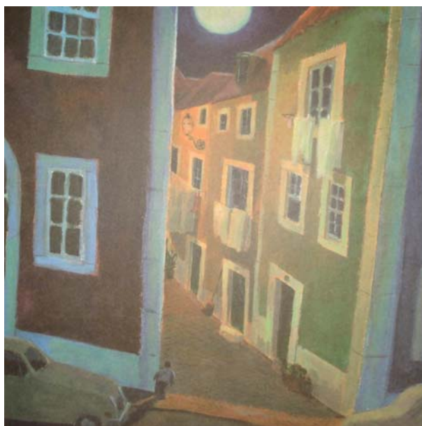
(CARVALHO & PRATT, 2003, p.6)

O segundo parágrafo do “Prólogo” explica o topônimo – “Creio que o nome lhe vem das sardinheiras (...), plantadas num canteiro que rompe logo à esquina” – e situa o Beco – “logo à esquina, não longe da drogaria que fica já na Rua dos Eléctricos”. A ilustração na página 6 de O homem que engoliu a Lua é uma imagem tomada de fora para dentro do Beco , destacando a esquina do Beco com uma rua em que passam carros – provavelmente a Rua dos Eléctricos – e mostrando à direita, próximo à porta de um dos prédios, um canteiro com plantas – provavelmente as sardinheiras.